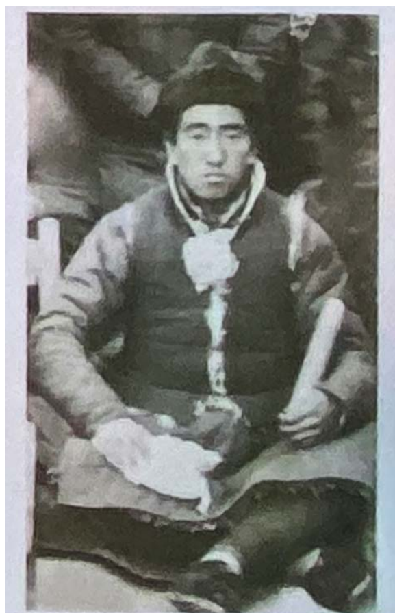
荣耀先高小毕业照