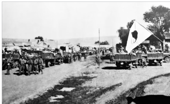
1937年10月14日，日伪军侵占归绥（呼和浩特）

1938年，在全国抗战进入最艰苦的时期，日寇长驱直入侵占了绥远省，又占领了包头。中国西北、黄河以南的鄂尔多