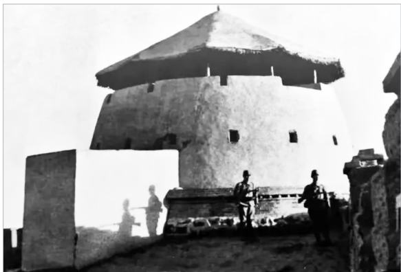
1937年10月17日，日伪军侵占包头

斯、陕北延安面临着日寇的威胁。1938年8月，毛泽东主席、朱德总司令指示八路军120师师长贺龙组建大青山抗日支队，由李井泉、姚喆、张达志率领八路军支队，从晋西北毅然挺进绥远大青山。在1941年，面对日军的严密封锁和扫荡，八路军120师在大青山地区，包括德胜沟、井尔沟、红召、巴总窑子、面铺窑子等地，依靠当地党组织和广大群众的支持，